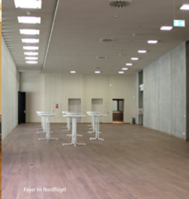
Foyer im Nordflügel